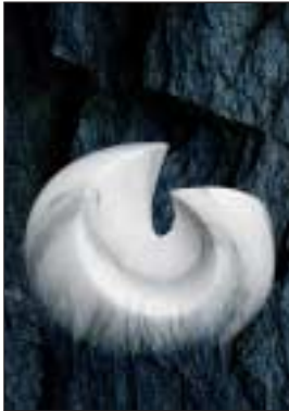
Das Titelmotiv „Steinzeit“, des Oldesloer Grafikers Hardy Fürstenau, können Sie, bei einer limitierten Auflage von 100 Stück, im Format 40x60 cm, auf Leinen gedruckt, für 98,- €/Stück bestellen.