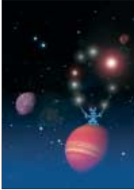
Das Titelmotiv „Oh, Stern!“, des Oldesloer Grafikers Hardy Fürstenau, können Sie, bei einer limitierten Auflage von 100 Stück, im Format 40x60 cm, auf Leinen gedruckt, für 98,- €/Stück bestellen.