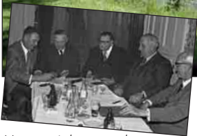
Unterzeichnung des Vereinigungsvertrages zwischen Langelohe, Papendorf und Kronshorst (1973)