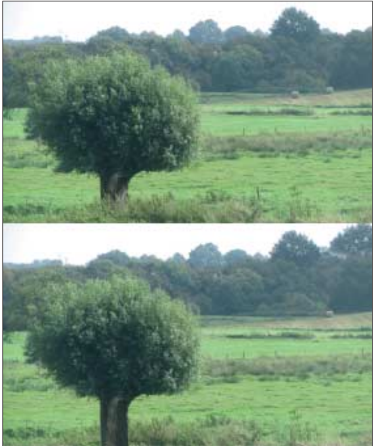
fehlerhaft: Wo sind die 7 Fehler auf dem unteren Bild?

Am 30. November 1835 wird der amerikanische Schriftsteller Mark Twain geboren.